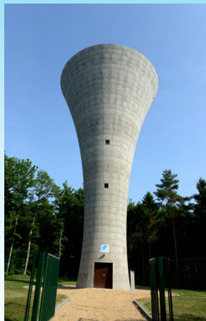
Château d'eau de La Madeleine de Nonancourt